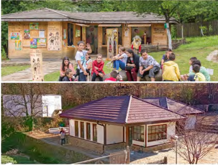
Старото преместваемо съоръжение и новата масивна сграда

Продължава от стр. 1 В детския център вече има течача вода и тоалетни, инсталирано е подово отопление, сигурността е решена чрез видеонаблюдение и сигнално-охранителна система. Всичко това ще позволи той вече да работи целогодишно, а не както досега – само през топлите месеци.