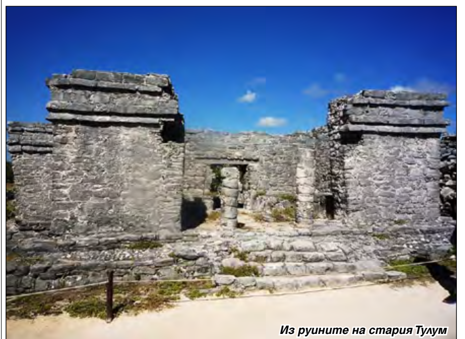
Из руините на стария Тулум