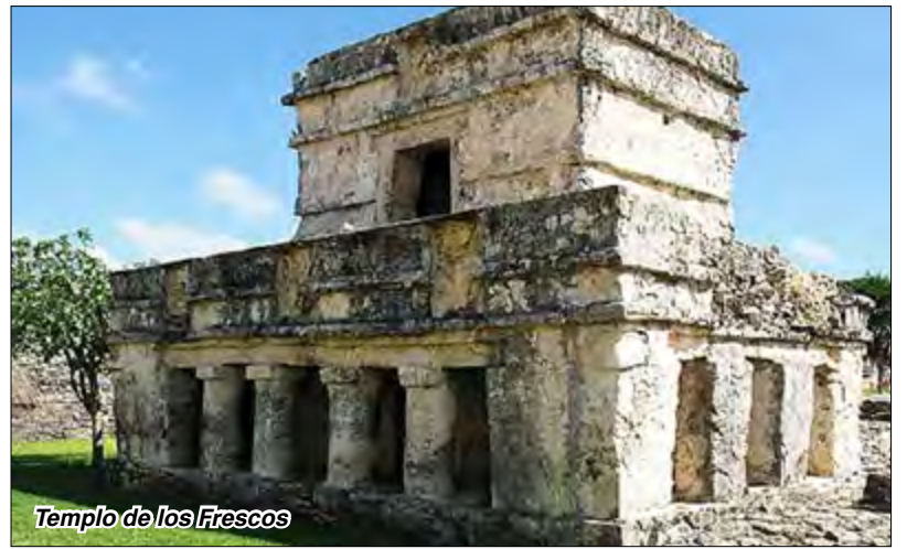
Templo de los Frescos