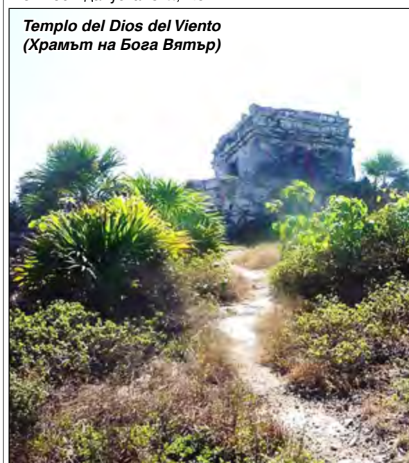
Templo del Dios del Viento (Храмът на Бога Вятър)