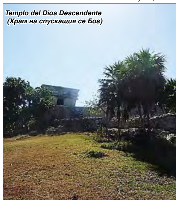
Templo del Dios Descendente (Храм на спускащия се Бог)