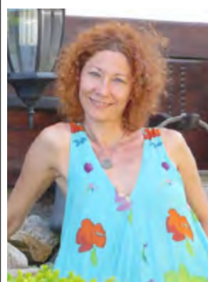
2 април 10:30 – 11:30 Узана Поляна Фест или как зелените идеи влизат в действие, за да сберат хиляди хора на най-високата билна поляна на Балканите, Виолета Янева