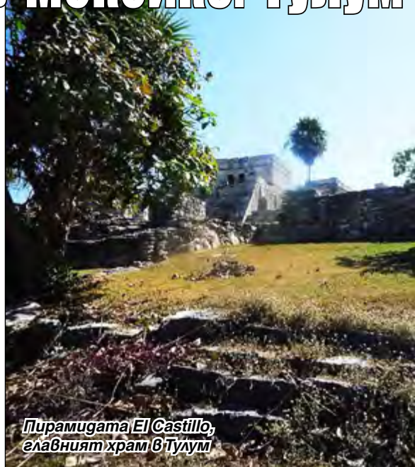
Пирамидата El Castillo, главният храм в Тулум

Ден по-късно се отправих към руините на стария град, които са на около 3 км от хотела. Тулум е единственият град на майте, който те са построили на море. Предполага се, че е имал пристанище, чрез което се е осъществявала активна търговия с народите от Централна Америка. Градът е разположен на скали, издигащи се на 12 м над карибския бряг, което е осигурявало сигурна защита откъм морето. Останалата част е оградена от крепостни стени високи от три до пет метра при дебелина около 8 м. Той е един от малкото градове на майте, които са имали защитни стени, а те може би са дали и неговото име, защото се предполага, че Тулум означава „ограден град“. Той е един от най-късните градове, построени и обитавани от майте, достигнал разцвета си през XIII в. – XV в. Навярно разположението му на море е главната причина да бъде първият тежен град, открит от испанците още през първата половина