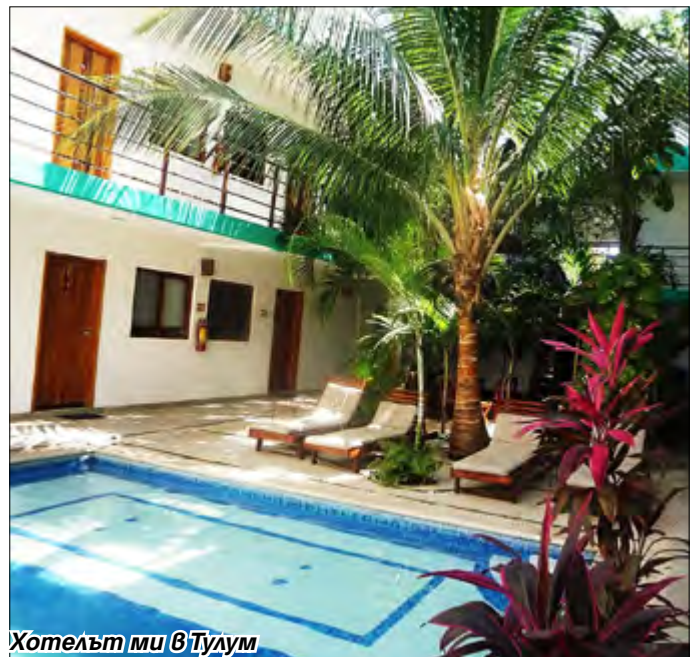
Хотелът ми в Тулум