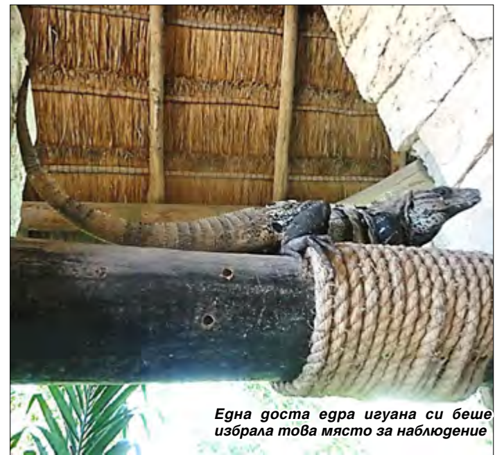
Една госта едра игуана си беше избрала това място за наблюдение