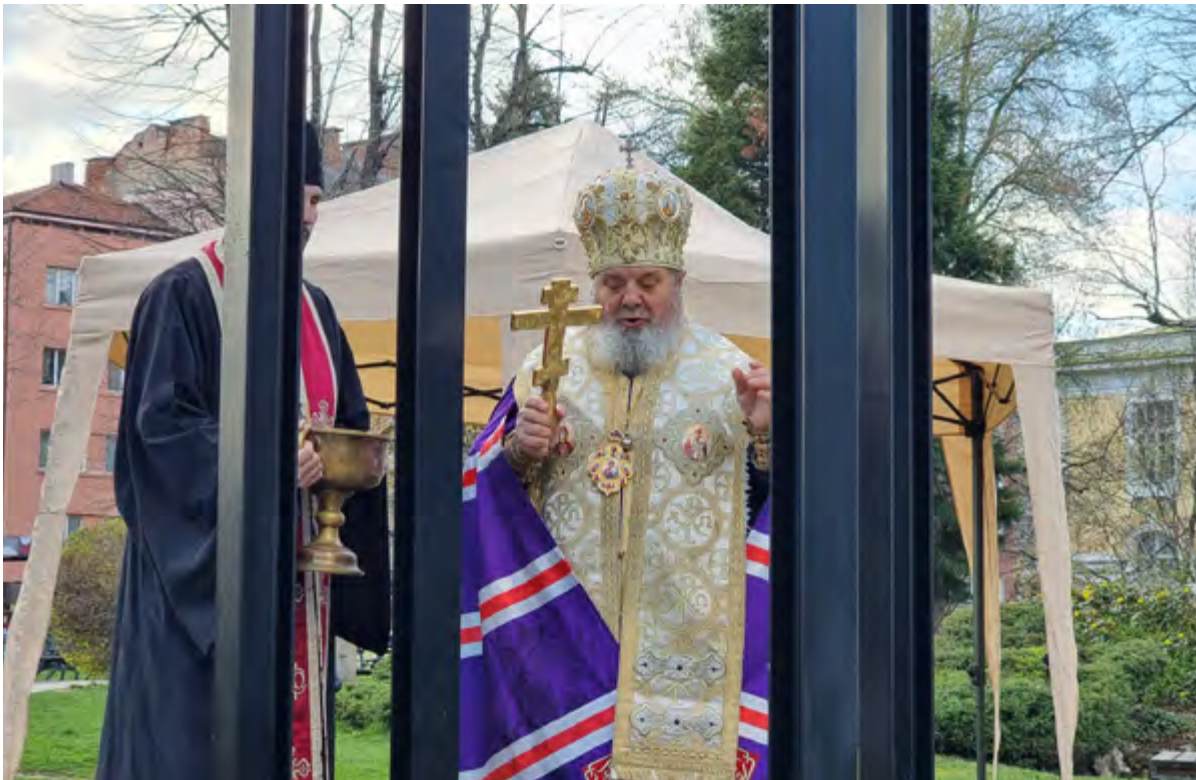
НА БЛАГОВЕЩЕНИЕ Негово Високопреосвещенство Великотърновският митрополит Григорий освети камбанарията – символ на храм „Св. Благовещение“ в Габрово.