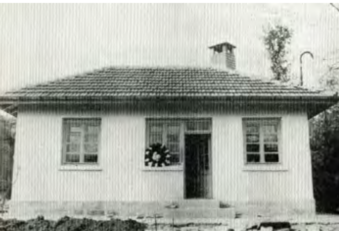
Къща музей „Митко Палаузов“, открита на 31 март 1964 г.

рил 1992), е запазена статистика за периода 1973 – 1990 г. От нея научаваме, че музейят работи между 340 и 365 дни в годината. До 1989 г., когато тържествено е чествана 25-годишнината от откриването му,