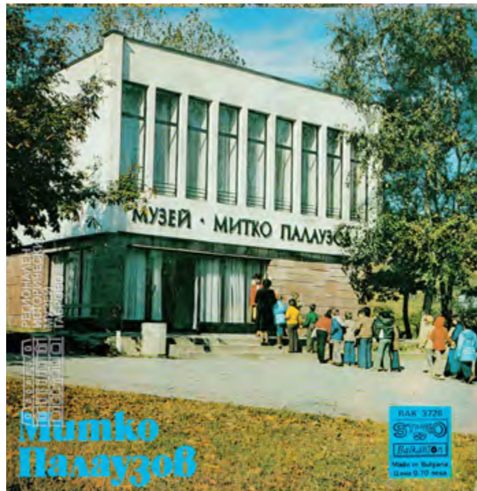
Експозиционна зала – музей „Митко Палаузов“, открита на 31 март 1971 г.

Всяко време със своите ценности..., до 1989 г. едни, днес други, но това е ходът на историята.... често ротационен. Инициативата за откриването и закриването на музей „М. Палаузов“ принадлежи на Исторически музей – Габрово (през годините ОИМ, ИИМ и днес РИМ), защото музеите, както и образованието, са проводници на официалната държавна политика и следват нейните нравствени и морални норми.