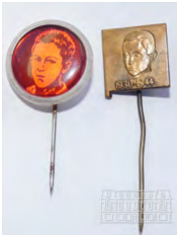
Значки с образа на М. Палаузов

Посещение на ученици в къщата музей, беседата води Трифон Палаузов