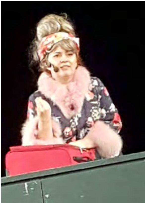
Актрисата драматург Здравка Каменова смени няколко самоличности в "Хитът на сезона".

– Любимец винаги ми е бил Мариус Куркински, сега добавих и Здравка Каменова.