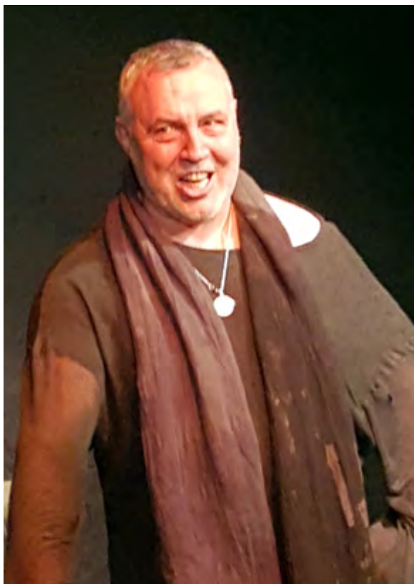
Понеже екзистенциалните въпроси нямат отговори Мутафчиев ги дискутира в бара на Юда, иронично наречен „Рай“