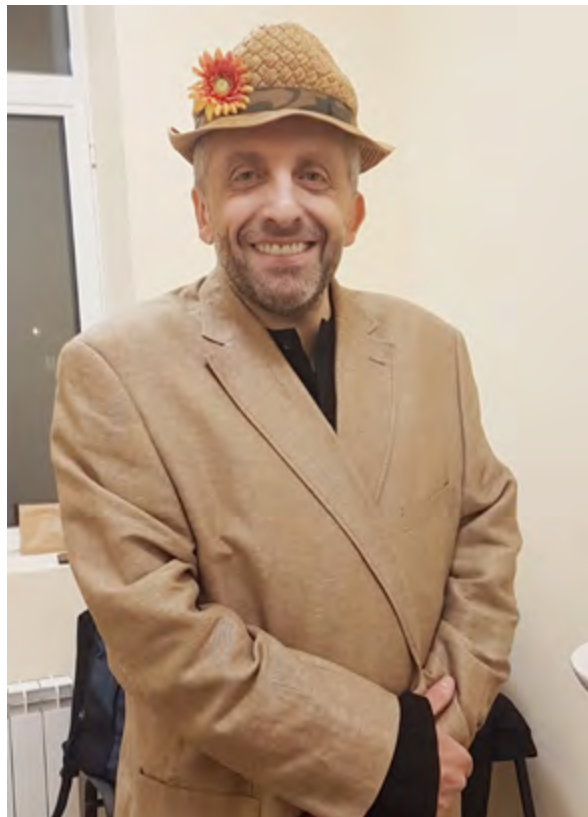
"Нашенец" е моноспектакълът, с който Мариус Куркински миналата година отбеляза 30 години на сцената