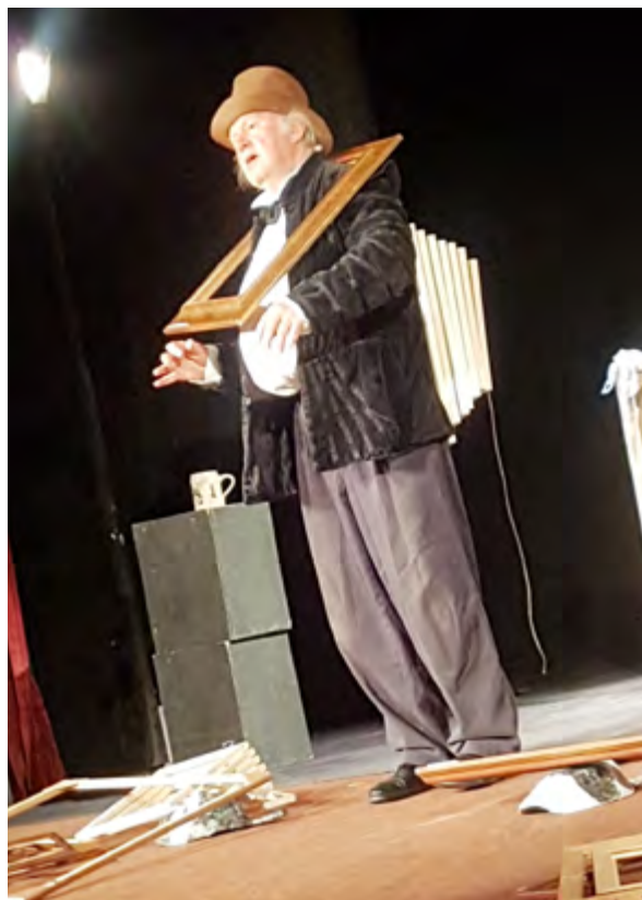
Спектакълът "Гоя" е за художника, който в края на живота си полудява. Снимките на страницата са на Вела Лазарова